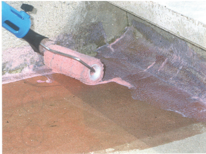
Mit einer Rolle auftragen